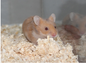
♂ Goldhamster Uber, geb. 18.04.2026