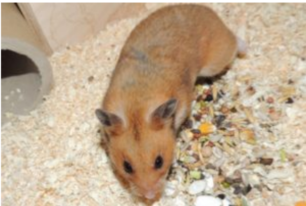
Wildfarben Goldhamsterweibchen „Franja“, geb. 18.02.2020 (472/20) in Marl