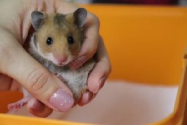
Wildfarben Goldhamster Männchen „Walt“, geb. 06.10.2020 (456/20) in Lünen