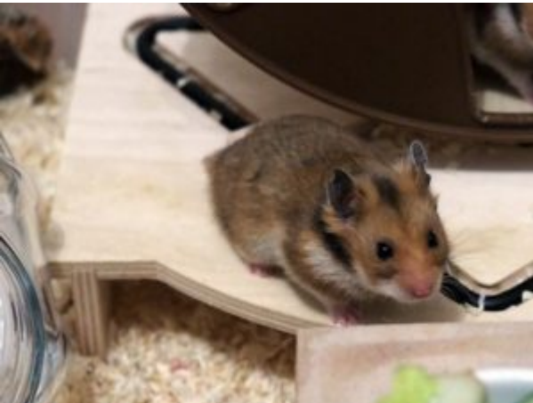
Wildfarben Goldhamster Männchen „Colorado“, geb. 31.08.2020 (465/20) in Köln-Dellbrück