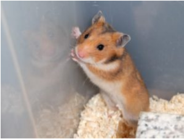
Wildfarben Goldhamsterweibchen „Money Penny“, geb. 18.02.2020 (471/20) in Marl