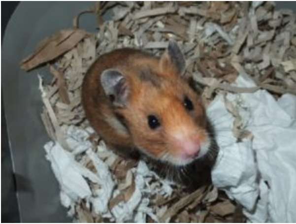
Wildfarben Goldhamster Männchen „Teddy“, geb. 24.04.2020 (479/20) in Iserlohn