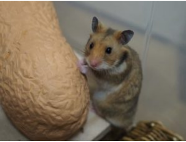
Wildfarben Goldhamster Männchen „Washington“, geb. 31.08.2020 (464/20) in Köln-Dellbrück